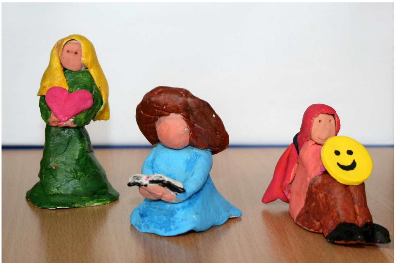
Iza Gračan, 3. b ZN – 1. mesto likovni natečaj