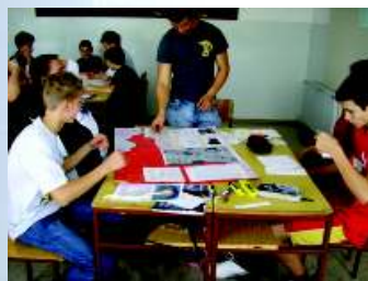
Na projektnih tednih delamo drugače.