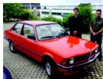
Obnavljamo stare avtomobile.