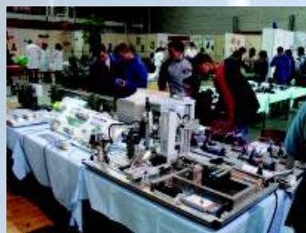
Predstavimo se na dnevih odprtih vrat.