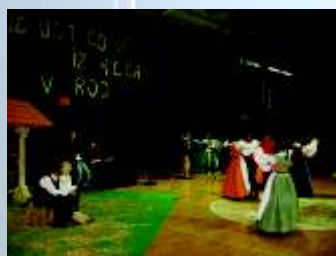
Na proslavi so dijaki igralci, plesalci in še kaj.