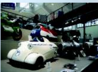
Hodimo na strokovne ekskurzije.