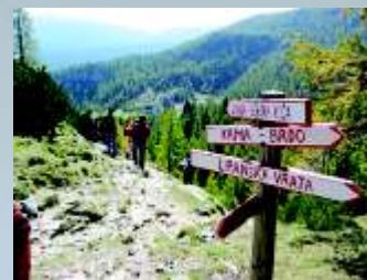
Športno smo aktivni na raznih področjih.